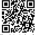
問い合わせページ